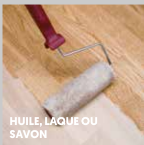
HUILE, LAQUE OU SAVON