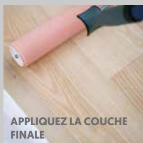
APPLIQUEZ LA COUCHE FINALE