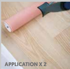
APPLICATION X 2

Soins semi-annuels : Master Care, #684125