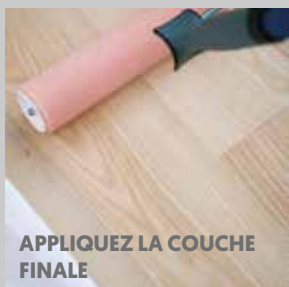
APPLIQUEZ LA COUCHE FINALE