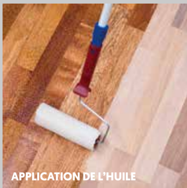
APPLICATION DE L'HUILE