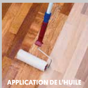
APPLICATION DE L'HUILE