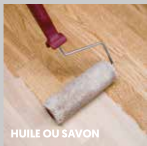
HUILE OU SAVON